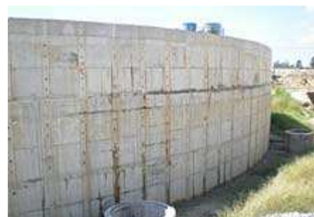
Foto tomada el 29 de marzo del 2008, Penetron ha detenido casi por completo las fugas en este tanque