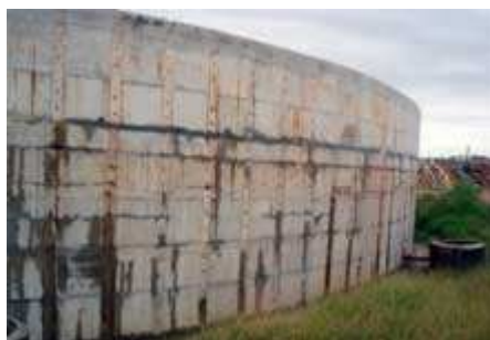
Foto tomada el 14 de marzo del 2008, mientras que Penetron ya ha sellado la mayoría de las fugas, aún hay importantes fugas a través de grietas

SABESP, la gran y básica compañía en América Latina utilizó el sistema de Penetron en el cumplimiento de su misión de proporcionar servicios de saneamiento imparcial universal, la mejora de la salud y la calidad de vida de los residentes en São Paulo. SABESP, planta de tratamiento de aguas residuales se encuentra en Taubate, São Paulo, en la región de Vale do Paraíba, una de las regiones más industrializadas de Brasil. Esta planta recibió un premio por la Agencia Nacional del Agua como el mejor diseño. Extensas pruebas de laboratorio internas han demostrado los beneficios de Penetron en la protección del hormigón y el sistema Penetron fue elegido para proteger todos los tanques y sellar las grietas existentes. La efectividad de Penetron fue visible para el cliente como casi todas las fugas y grietas, que fueron selladas en el transcurso de 2 semanas ( ver fotos abajo ). SABESP, planta de tratamiento de todas las aguas residuales de ambos, Taubate y la región adyacente de Tremembe, que suministra el total de una población combinada de más de 300.000 personas. La capacidad actual de la primera fase se ha fijado en 1'050 l / s y se incrementará aproximadamente en un 40% a 1'450 l / s para el año 2020.